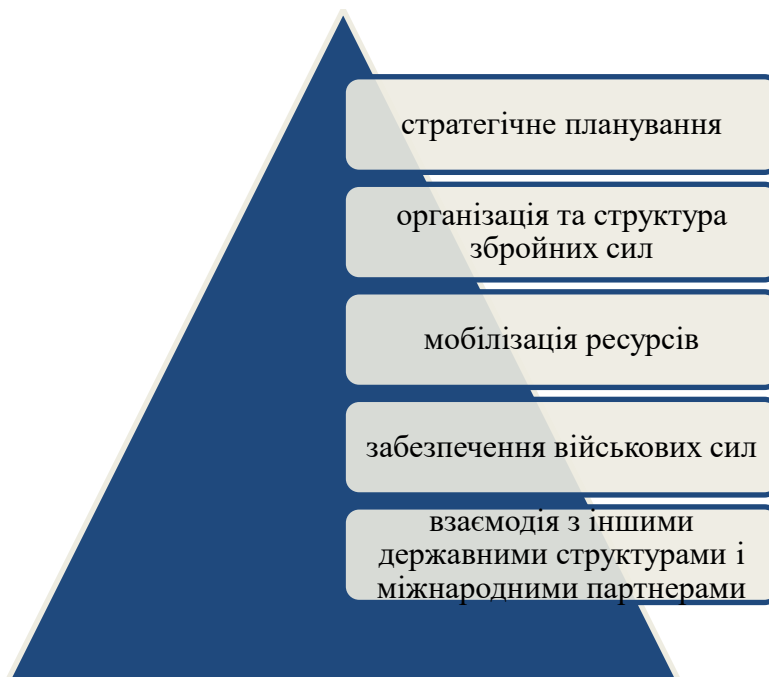
Рис.1.1. Основні складові воєнної політики

організацію та структуру збройних сил, мобілізацію ресурсів, забезпечення військових сил, а також взаємодію з іншими державними структурами і міжнародними партнерами (рис.1.1).